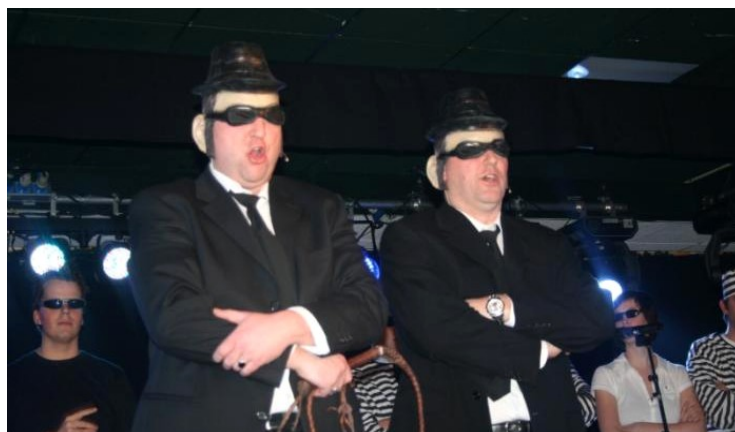
Voorproefje tijdens zittingsavonden