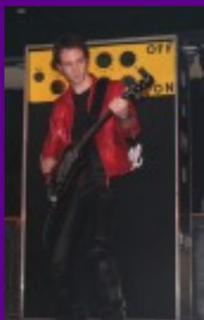
Kan het wat harder?