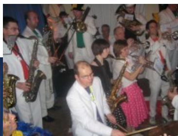
Mooi wit is niet lelijk!