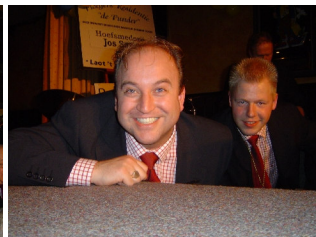
Tsja, dan maar ff lache :)