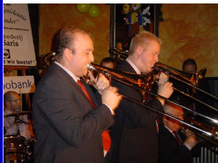
Trombone? Te moeilijk...