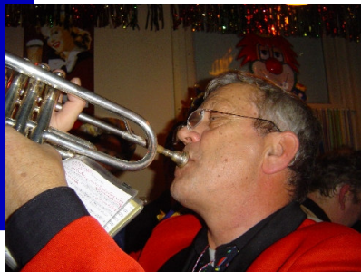
Close-up van de muzikaal lei/ijder