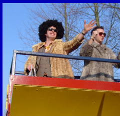
Blik op de toekomst?