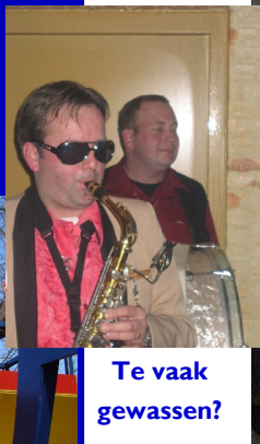
Te vaak gewassen?