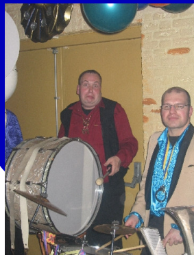
Waar is Tom?