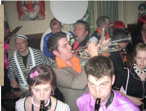
Zooitje ongeregeld, maar wel gezellig!!!