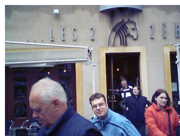
Betrapt in kroeg in Metz