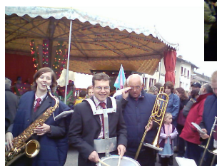
Op de kermis