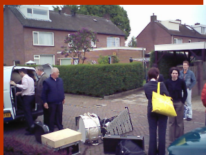
Passen en meten